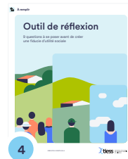
4 Outil de réflexion. 9 questions à se poser avant de créer une fiducie d'utilité sociale