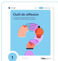
1 Outil de réflexion. 7 questions à se poser avant de créer une fiducie d'utilité sociale de données

Des outils concrets pour guider la création d'une fiducie d'utilité sociale de données ou d'une fiducie d'utilité sociale