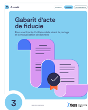
3 Gabarit d'acte de fiducie : pour une fiducie d'utilité sociale visant le partage et la mutualisation de données