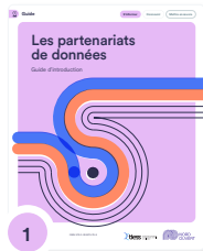
1 Les partenariats de données : guide d'introduction

Des documents à lire, selon vos besoins, à l'étape d'idéation d'un projet