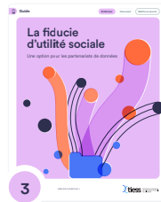
3 La fiducie d'utilité sociale : une option pour les partenariats de données