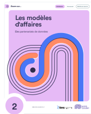
2 Les modèles d'affaires des partenariats de données