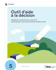
5 Outil d'aide à la décision. Questions et exercices pour concevoir collectivement votre acte de fiducie d'utilité sociale