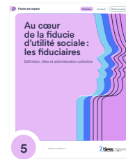
5 Au cœur de la fiducie d'utilité sociale : les fiduciaires. Définition, rôles et administration collective