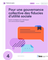
4 Pour une gouvernance collective des fiducies d'utilité sociale : quatre stratégies pour développer une communauté engagée