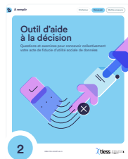
2 Outils d'aide à la décision. Questions et exercices pour concevoir collectivement votre acte de fiducie d'utilité sociale de données